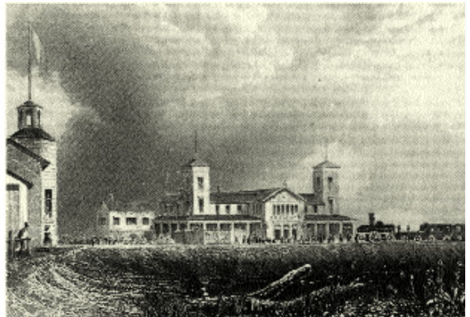
A. H. Payne, Kassenhaus und Frascati, 1842

Für die Personenbeförderung erhoffte man durch Ausflügler, die in einer halben Stunde von Hamburg nach Bergedorf gelangen konnten, eine weitere beträchtliche Ausweitung des Verkehrs. Das Bergedorfer Gehölz, vor allem aber die gepflegten Gaststätten, die am Endpunkt der Bahn erbaut wurden, sollten Gäste locken. Es waren am Neuen Weg die großen neuen Wirtsbetriebe Frascati, Collosseum, Portici und die Eisenbahnhalle (später Hitscher). Diese Namen waren damit Paten für die Bezeichnung „Italienisches Viertel“. Der Neue Weg war damals der Hauptweg vom Städtchen Bergedorf in die Vierlande!