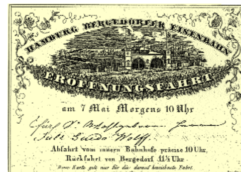
Die Einladung zur 1. Fahrt zeigt den Bahnhof in Hamburg-Hammerbrook

So mußte die Bahnlinie innerhalb Bergedorfs verschwenkt werden und der Ort erhielt 1846 einen neuen, zweiten Bahnhofsbau - jetzt an der Grenze zu Sande-Lohbrügge. Damit war die Errichtung der Gaststätten-Bauten am Neuen Weg eine erste Fehlspekulation der beginnenden „neuen Zeit“.