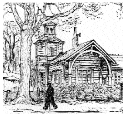
W.Götze, Der alte Bahnhof , 1969

Über das Grundstück selbst führt parallel zur Brookwetterung ein neuer Wanderweg, der den Neuen Weg mit der Vierlandenstraße verbindet. Ihm folgend gelangt man über die Friedrichsbrücke (Schleusengraben) schnell zum dritten Bergedorfer Bahnhof - dem DB- und S-Bahnhof von 1937!